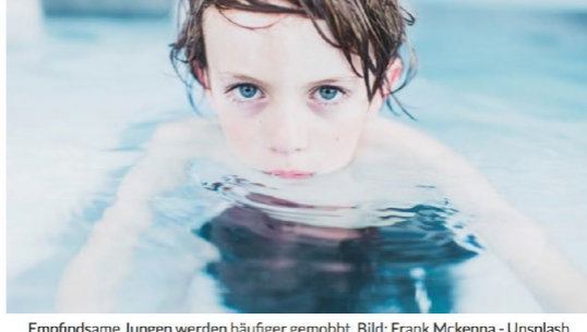
Empfindsame Jungen werden häufiger gemobbt.