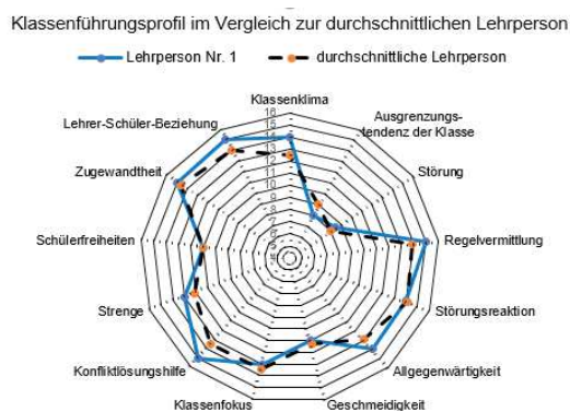
Abbildung 2: Beispiel eines individuellen Klassenführungsprofils im Vergleich zur durchschnittlichen Lehrperson

Lehrpersonen sollten demzufolge Klassenklima, ihren Beitrag zur Gruppendynamik als auch ihre eigene Klassenführungs-kompetenz anhand von Fremd- und Selbstwahrnehmungsanalysen gut einschätzen können, wie folgendes Beispielprofil zeigt.