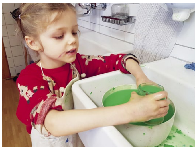
Sensibilisierung des Farbempfindens