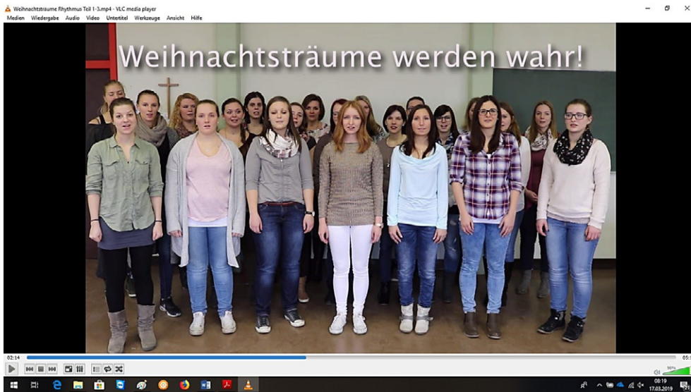
Abbildung 2: Screenshot Lernvideo „Rhythmus Teil 1-3“, Response-Phase, 02:14

Analog verläuft der Prozess des Lernens der melodischen Strukturen, wobei sich die/der Lehrende hier selbst und die Studierenden auf einem E-Piano begleitet. Ob Online-Lernende mit dem Erlernen der sprachrhythmischen Strukturen beginnen oder gleich mit dem Singen, ist nicht vorgegeben und kann je nach musikalischem Können. Interesse etc. individuell und jedes Mal neu entschieden werden.