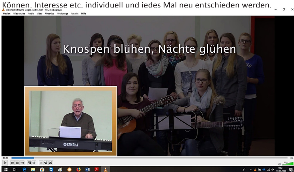
Abbildung 3: Screenshot Lernvideo „Singen Teil 1“, Call-Phase, 00:08

Analog verläuft der Prozess des Lernens der melodischen Strukturen, wobei sich die/der Lehrende hier selbst und die Studierenden auf einem E-Piano begleitet. Ob Online-Lernende mit dem Erlernen der sprachrhythmischen Strukturen beginnen oder gleich mit dem Singen, ist nicht vorgegeben und kann je nach musikalischem Können. Interesse etc. individuell und jedes Mal neu entschieden werden.