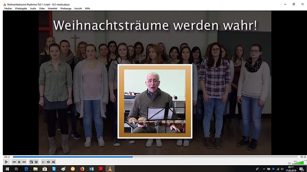
Abbildung 1: Screenshot Lernvideo „Rhythmus Teil 1-3“, Call-Phase, 02:11