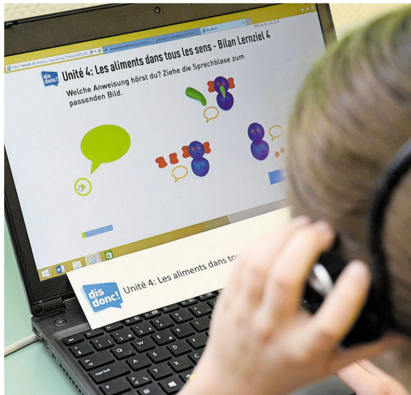
Auf einer Onlineplattform finden Schüler zusätzliche Übungen und Tests.

Wolfer beschreibt das Prinzip so: «Einmal lernen, mehrmals brauchen.» Dazu kommt: Viele Kinder beherrschen schon bei der Einschulung mehr als eine Sprache. «Ein Kind, das zu Hause Portugiesisch spricht, lernt blitzschnell Französisch.»