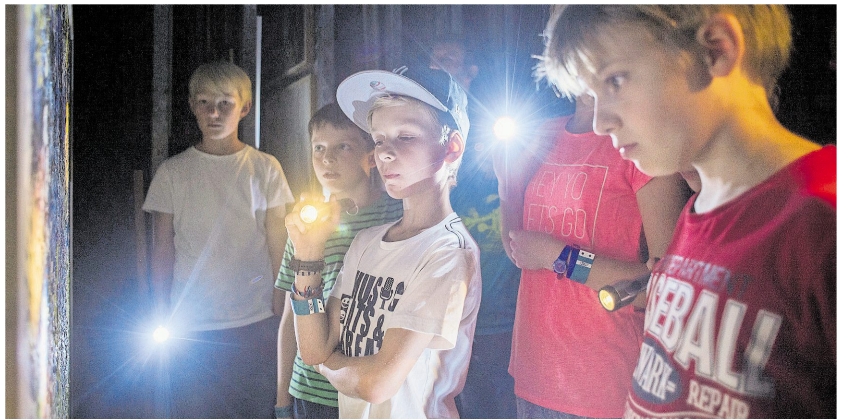
Mit Taschenlampen suchen diese Buben im Gemäldedepot des Kunstmuseums nach verborgenen Schätzen.