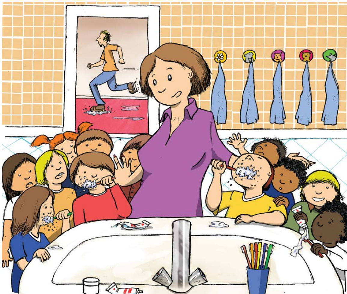
Bodenaufnehmen, Zähneputzen: Gibt der Putzplan den Takt an?

Kinder der Gruppe sehr häufig von den Erwachsenen ermahnt, weniger zu toben, leiser oder ruhiger zu spielen. Bewegung wurde „ausgelagert“, d.h. sie fand in einem Raum statt, in dem ein Parcours aufgebaut wurde, oder während Spaziergängen, bei denen die Kinder explizit aufgefordert wurden, zu rennen und sich zu bewegen. Neben dem Aspekt, dass wildere Spiele und Bewegung häufig zugunsten ruhiger Tätigkeiten in den Hintergrund treten, weicht auch die zeitliche Gestaltung des Tages oft dem ab, was sich die Mitarbeiterinnen und Mitarbeiter eigentlich wünschen. So haben viele Kitas den Anspruch, kindzentriert zu arbeiten und ver-