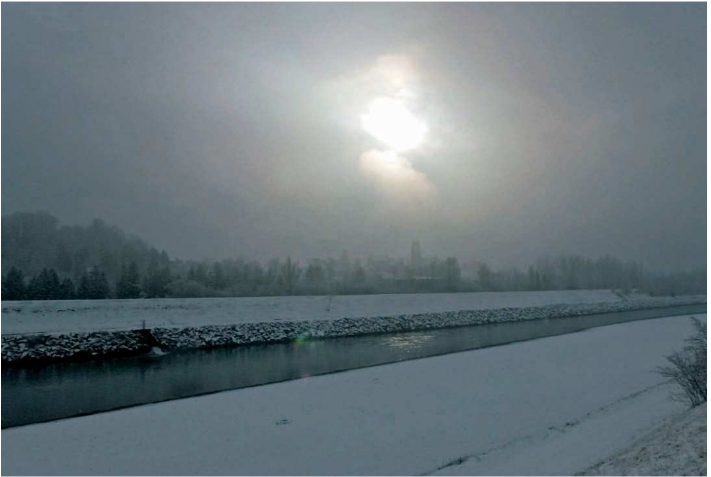
Novemberschnee am Alpenrhein bei Haag-Bendern.

damalige Bauer lediglich aufgrund seiner subjektiven Wahrnehmung und Erfahrung.