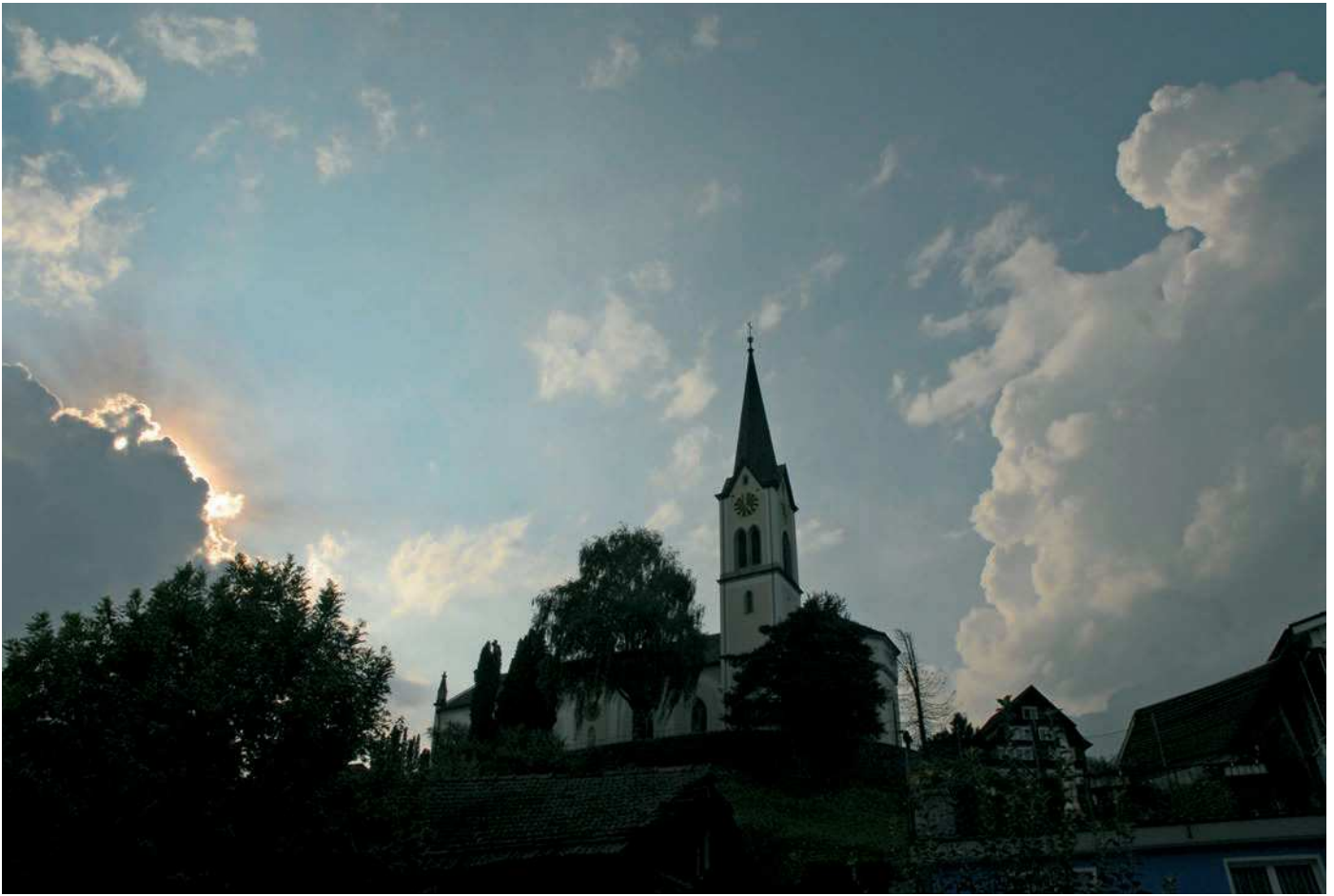
Über der Gamser Pfarrkirche St. Michael braut sich ein Gewitter zusammen – Zeit, um das für Gams charakteristische Wetterglöcklein zu läuten.

ähnlich wie bei der Sonnenscheindauer – drei Kategorien gebildet und der Mittelwert ausgeweitet: Alle Tage, deren Tagesmittel den langjährigen Tagesmittelwert nicht um mehr als 2°C über- oder unterschreiten, erhalten damit das Prädikat mittel.