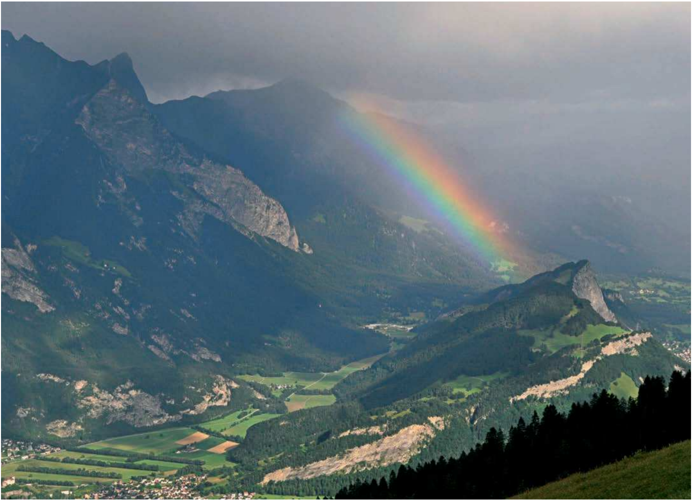
Gewitterfront über der Luziensteig.

Mit Zunahme der Zeitdauer des Herbstes nimmt auch die Eintrittshäufigkeit der Bauernregel zu. Die Aussage « dr ganz Herbst », kann also tatsächlich wörtlich aufgefasst werden. Aus meteorologischer Sicht ist das höchst erstaunlich, da die Vorhersagegenauigkeit herkömmlicher Prognosen mit Zunahme der Zeitdauer abnimmt. Die spezielle Bedeutung des Michaelistags für das Herbstwetter konnte mit den durchgeführten Untersuchungen bestätigt werden. Betrachtet man für den Lostag nicht nur einen einzelnen Tag, sondern einen Zeitraum von drei beziehungsweise fünf Tagen, wird die Eintrittswahrscheinlichkeit der Bauernregel nicht grösser. Tendenziell ist sogar das Gegenteil der Fall. Wird für den Michaelistag nur der 29. September be-