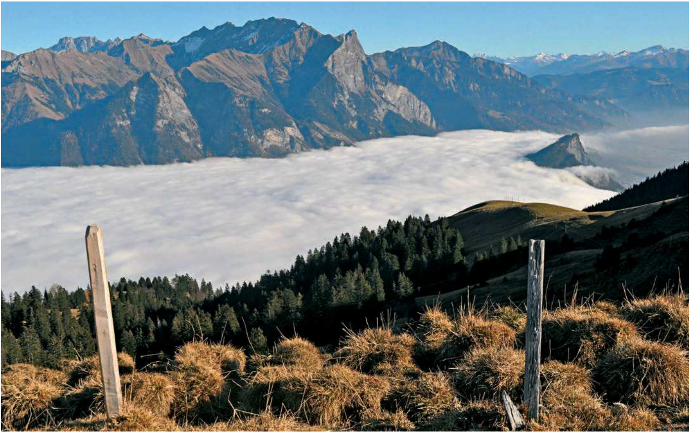
Typische Inversionslage mit «Wettergrenze» am Fläscher Berg (rechts).

buch, insbesondere der Band 2013 mit dem Schwerpunktthema «Sagenhaftes Werdenberg». 5