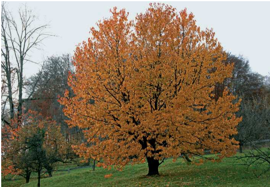
Goldene Pracht an einem 19. November am Saxer Berg.

Die geografische Einteilung von Bauernregeln gestaltet sich als sehr schwierig. Bei den Recherchen war der Band Bauernregeln: Eine schweizerische Sammlung mit Erläuterungen von grosser Bedeutung. 3 Weitere wertvolle Hinweise lieferten im Werdenberg ansässige Personen mit einem Flair für das Wetter, so auch der Buchser Mario Slongo, der dank seiner jahrelangen Tätigkeit beim Schweizer Radio als «Wetterfrosch» bekannt geworden ist. Nützliche Quellen sind auch das Büchlein Wartouer Spröch un Sprütz 4 oder das Werdenberger Jahr-