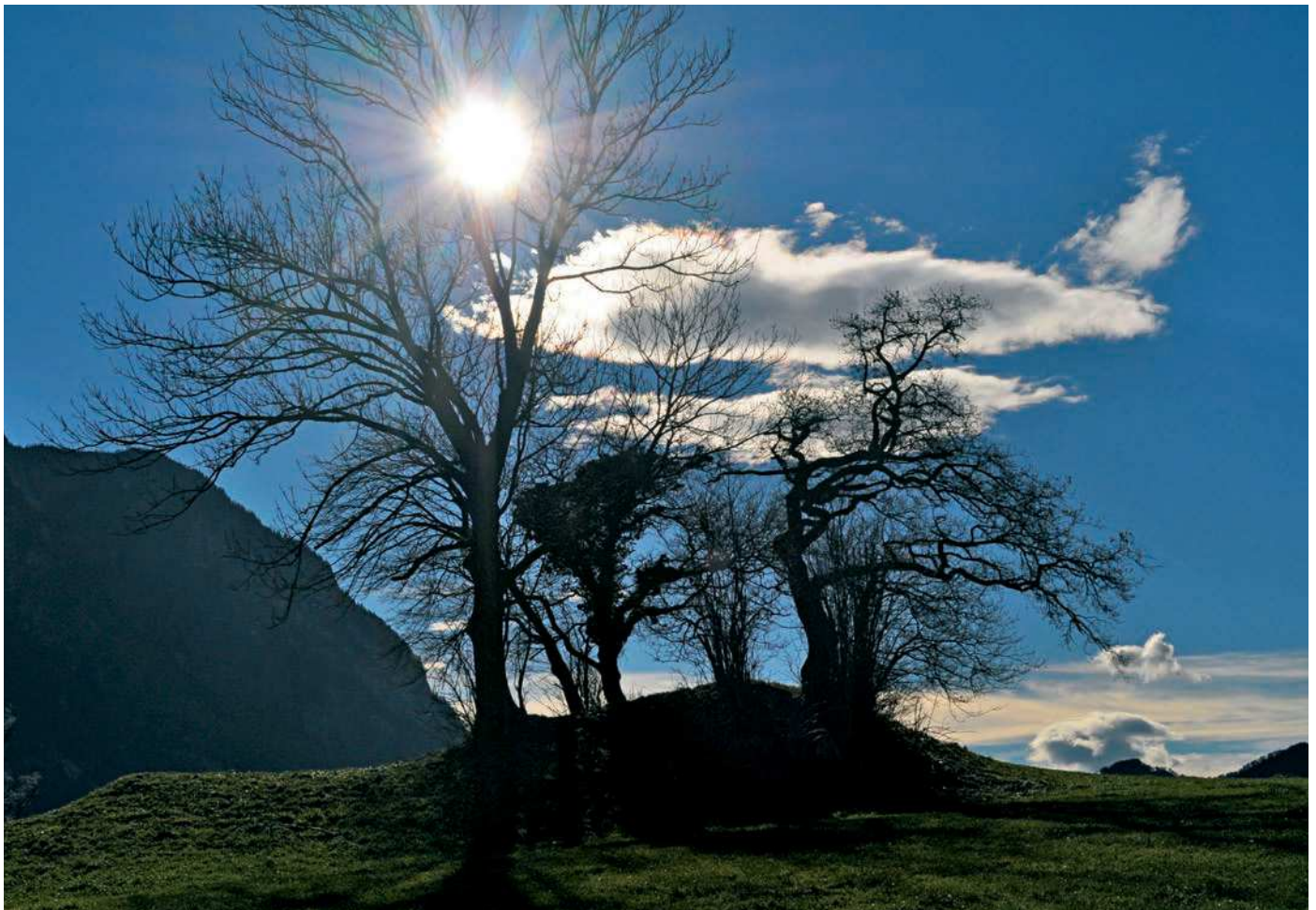
Die Region Werdenberg ist stark vom Föhn beeinflusst, der die Vegetationsdauer wesentlich verlängert.

Diese Überlegungen können analog für den Zeitraum «Winter» durchgeführt werden. Von wann bis wann dau-