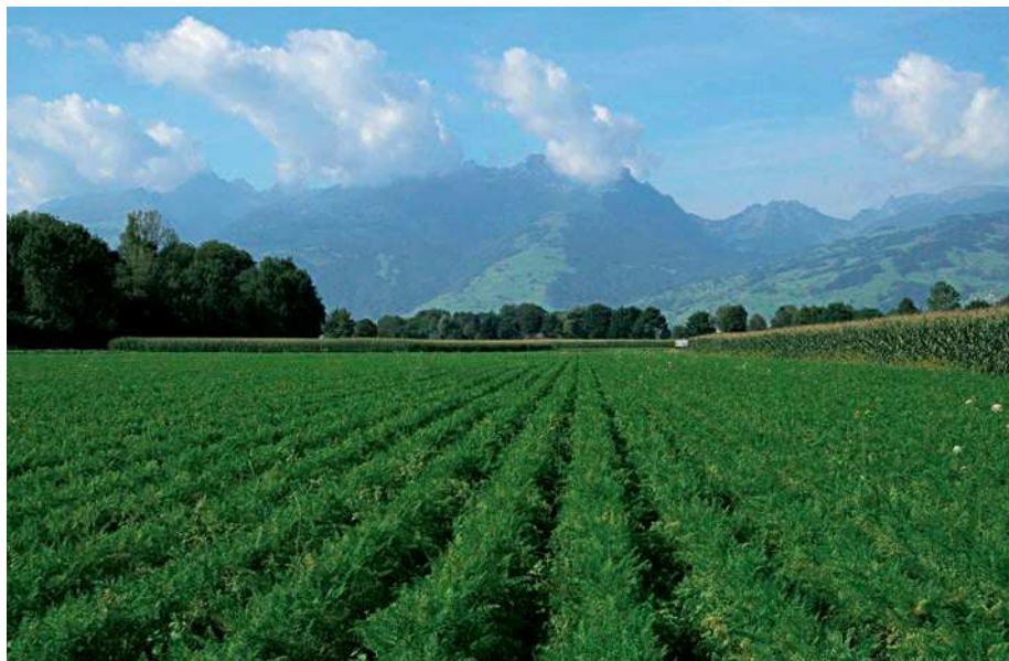
Während die rheinnahen fruchtbaren Fluvisolböden der Werdenberger Talebene gute Grundlagen für Acker- und Gemüsebau bieten ...

Das Klima ist für den Menschen als Gesamtheit der Wettererscheinungen an seinem Lebensort erfahrbar. Dabei sieht sich ein hochkomplexes naturwissenschaftliches System konfrontiert mit einem sozialen Konstrukt. Es ist wichtig, dass das wahrgenommene «typische Wetter» nicht mit dem gemesse-