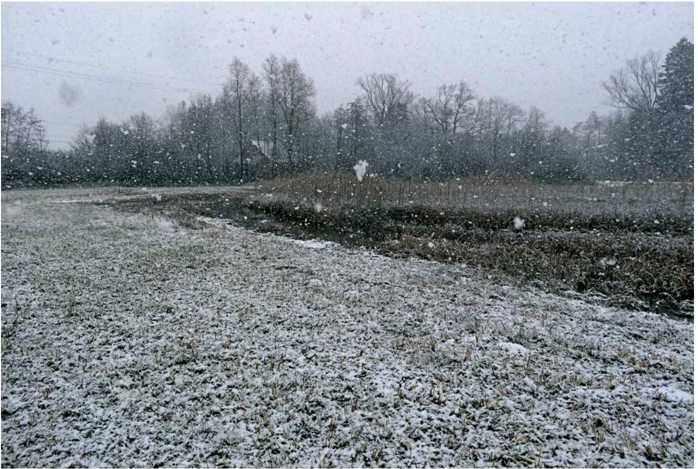
Schneegestöber im November im Niederholz bei Sennwald.

mit einzubeziehen. Durch das Betrachten verschiedener Zeiträume für den Michaelistag soll die Frage geklärt werden, ob das Wetter an einem einzelnen Tag entscheidend ist für den weiteren Verlauf der Witterung, oder ob bessere Prognosen gemacht werden können, wenn die Tage vor und nach dem Michaelistag auch mit einbezogen werden.