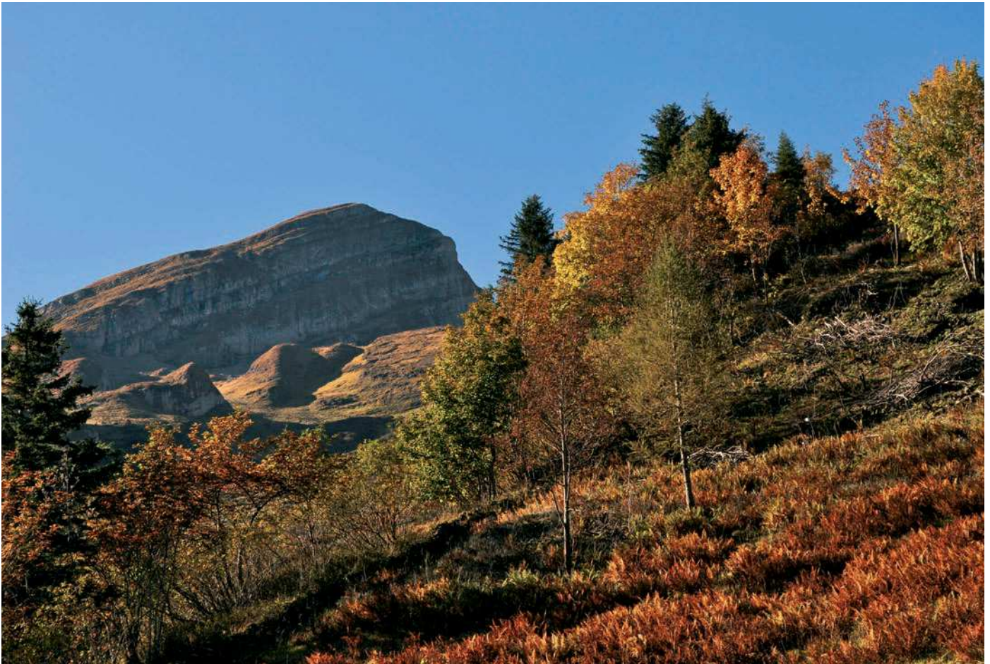
«Indian Summer» in der Alp Imalschüel mit Blick gegen den Alvier.

denen ein bestimmtes Wetter vorherrscht. Dafür ist das Festsetzen eines Tages-Normwertes erforderlich, der definiert, unter welchen Bedingungen ein Tag ein bestimmtes Prädikat erhält. Nun können die Tage mit gleichem Prädikat gezählt werden. Um eine Aussage machen zu können, ob ein grösserer Zeitraum ein bestimmtes Prädikat erhält, muss ein Jahreszeiten-Normwert definiert werden. Dieser entscheidet darüber, wie viele einzelne Tage mit einem bestimmten Beiwort nötig sind, damit die ganze Jahreszeit dieses Prädikat erhält.