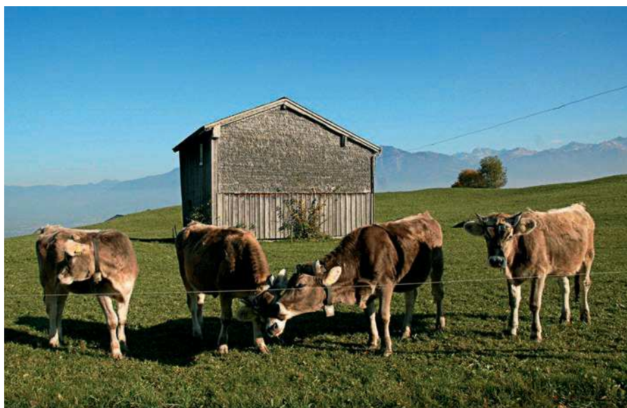
... steht in der landwirtschaftlichen Nutzung des Berggebiets – hier auf Mumpelin am Grabser Berg – die Vieh- und Alpwirtschaft im Vordergrund.

nen «durchschnittlichen Wetter» verwechselt wird. Ersteres bezieht sich vor allem auf das Auftreten von Extremsituationen, Letzteres ist eine mathematische Berechnung, die in der Realität nicht vorkommt.